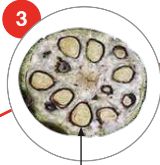
Καρύδι πλήρως ώριμο με περισπέρμιο σκούρο μαύρο. Ψεκασμός για αποφύλλωση επιβεβλημένος.