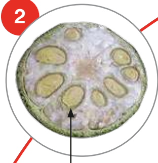
Καρύδι πιο ώριμο, με περισπέρμιο που διακρίνεται σαφώς. Κατάλληλος χρόνος εφαρμογής αν το 70% των καρυδιών είναι σ αυτή την κατάσταση και το 50% έχει ανοίξει.